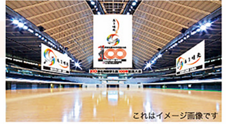
これはイメージ画像です